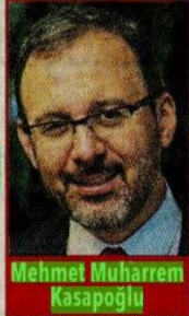
Mehmet Muharrem Kasapoğlu

Başvuru işlemleri hakkında Gençlik ve Spor Bakanlığı Kurumsal İletişim Merkezi (444 0 472) ve resmi Twitter destek hesabı KYGM_DESTEK üzerinden 7 gün 24 saat bilgi alınabiliyor.